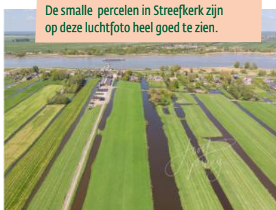
De smalle percelen in Streefkerk zijn op deze luchtfoto heel goed te zien.

Om een stukje van het populaire Floris V-pad te lopen, moet je vlak voorbij Streefkerk linksaf slaan en parkeren bij de sportvereniging (VV Streefkerk). De tiendweg die daar begint en naar het westen loopt, is het Floris V-pad (etappe 07).