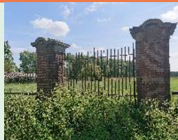
Alleen de 18de-eeuwse toegangspoort geeft aan dat hier ooit een landgoed lag.