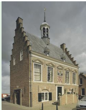
Het voormalige raadhuis uit 1642 staat op de dam in de Broekse Stroom. De buitenhaven lag achter het raadhuis en werd gedempt in 1820.

Van dat middeleeuwse verleden is nu weinig meer te zien. Behalve dat de kerk aan de Kerkstraat een 13de-eeuwse romaanse toren heeft, die graaf Floris nog gezien kan hebben. De oudste gebouwen in de huidige kern van Ameide dateren overwegend uit de 17de en 18de eeuw.