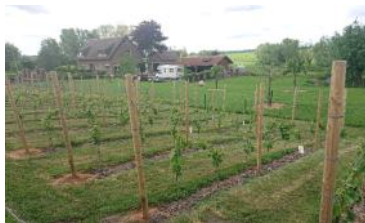
Aan de lizzijde van de Zouwendijk heeft een van de bewoners een kleine wijngaard aangelegd.

Het Hoenderwiel, een tastbare herinnering aan de doorbraak van de 13de-eeuwse Diefdijk in de 17de eeuw.