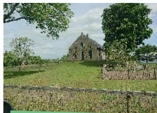
Aan de overkant van de rivier ligt Oud-Alblas, een van de oudste dorpen van de Alblasserwaard. Aan de Noordzijde is een lint boerderijen te zien; de lage heuvels waarop sommige ervan staan, zijn aanzienlijk ouder dan de huidige bebouwing.

Waar de weg rechtsaf overgaat in de Peperstraat, Kooiwijk en vervolgens Kortland, volg je een oude meander van de Alblas. Die omsluit de Polder Grote Nes. De volgende meander omsluit de Polder Souburgh.