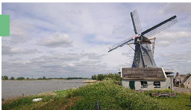
Molen De Liefde aan de Lekdijk bij Streefkerk.

De route volgt voor een groot deel de ringdijk uit 1277, al is die sindsdien natuurlijk vele malen verhoogd, verbreed en verzaard en we zijn dus af en toe in Utrecht en niet in Zuid-Holland.