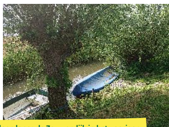
Wilgen langs de Zouwendijk in het voorjaar.

Sla na de tunnel onder de A27/E311 rechtsaf om de Zouwendijk te blijven volgen, die bij Sluis een bocht naar links maakt en dan de Lekdijk wordt.