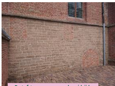
De tufstenen muur aan de zuidzijde van de kerk in Tienhoven.

Vlak voor Nieuwpoort, in het plaatsje Langerak, ligt links het terrein waar kasteel Langerak stond.